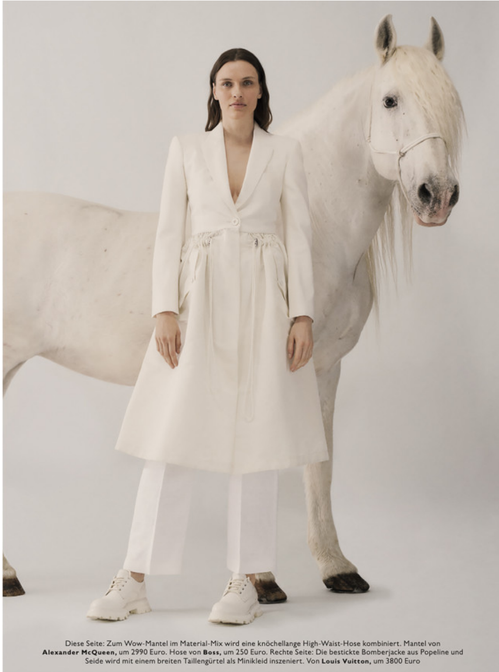
Diese Seite: Zum Wow-Mantel im Material-Mix wird eine knöchellange High-Waist-Hose kombiniert. Mantel von Alexander McQueen , um 2990 Euro. Hose von Boss , um 250 Euro. Rechte Seite: Die bestickte Bomberjacke aus Popeline und Seide wird mit einem breiten Taillengürtel als Minikleid inszeniert. Von Louis Vuitton , um 3800 Euro